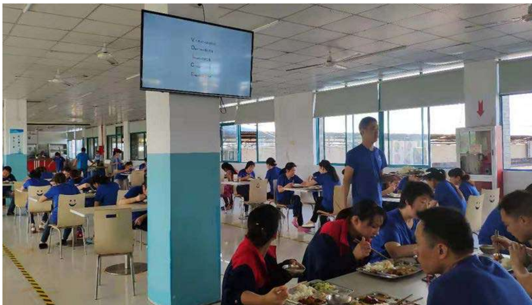
图为员工正在食堂收看价值观影片

价值观视频分别以《诚信正直》、《大勇无惧》、《拥抱变革》、《换位思考》为主题，由工厂一线员工亲自出演，以主人翁的角色演绎，说出了员工身边的故事。