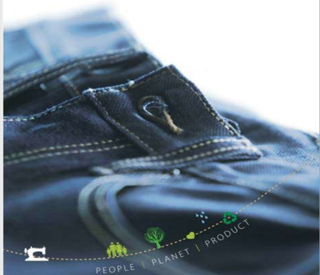
图为集团企业社会责任报告书