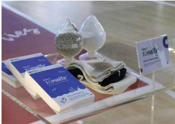
回收聚酯Top Green 产品系列

台北纺织展以创新应用作为台湾纺织业的核心推广平台，持续聚焦在“智慧纺织、永续环保、机能应用”三大核心主题，展出具有高新技术及高质量的智慧机能兼具环保与流行的纺织品。