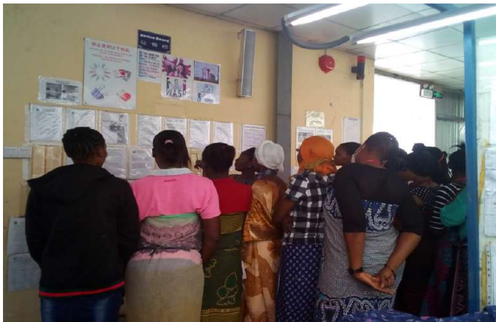
图为员工在认真阅读公告栏的公告宣传

坦桑尼亚工厂每月持续进行各类安全方面的培训，包含机器安全培训，性骚扰防止，消防演习等，致力于打造安全健康的工作场所，让员工避免工作伤害，安心工作。