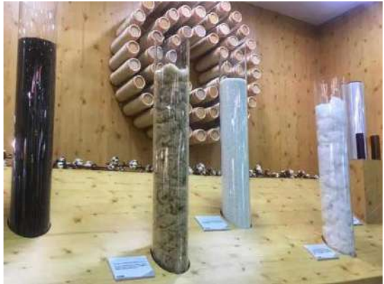
可再生材料制作的精美针织面料

本届台北纺织展在3天的时间里通过举办11场研讨会来透视产业脉动，其中包括：智慧型纺织品创新趋势、台湾纺织品新趋势发表会，以及新纤维、新技术发展趋势等各项议题。